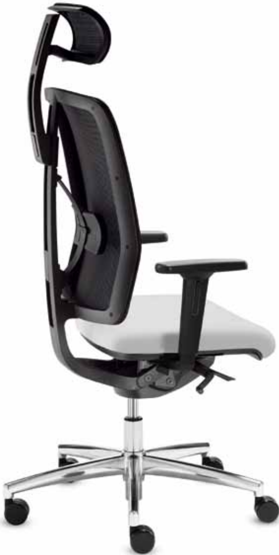
DS+ DA 80515 + Armlehnen/Armrests 171

Drehstuhl mit Komfortsitz und hoher Netz-Rückenlehne (58 cm) mit Nackenstütze. Die Delta-Synchron-plus-Mechanik ermöglicht entspanntes Relaxen mit einem Öffnungswinkel bis zu 128°. Multifunktionale Armlehnen mit soften PU-Auflagen.