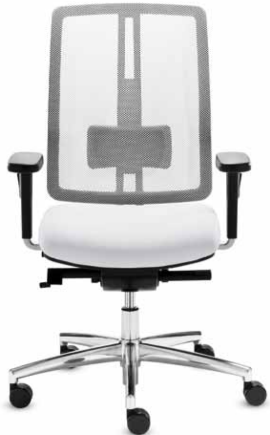
DS DA 80405 + Armlehnen/Armrests 172

Swivel chair with comfort seat and high mesh backrest (58 cm) with neckrest. The Delta-Synchron-plus mechanism allows relaxed sitting with an opening angle up to 128°. Multi-functional armrests with soft PU armpads.