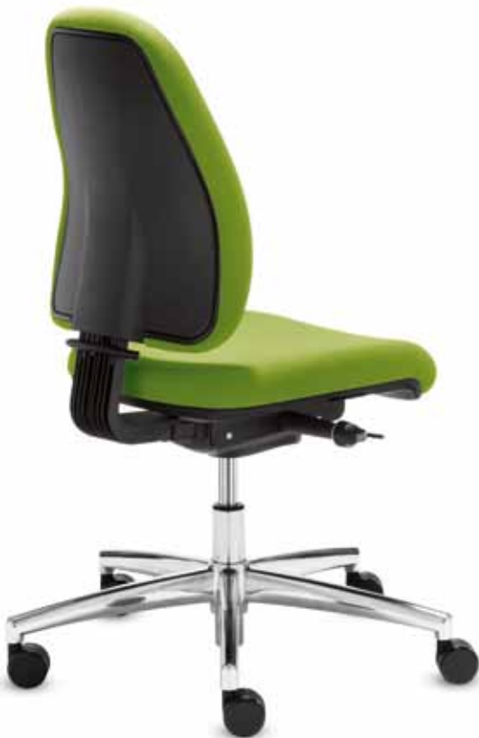
DB FO 93050

Drehstuhl mit besonders flexibler, mittelhoher Kunststoff-Rückenlehne (52 cm) für optimalen Sitzkomfort . Daumatic-Balance®-Mechanik für eine automatische Anpassung des Körpergewichts sowie zuschaltbarer Sitzneige-Automatik.