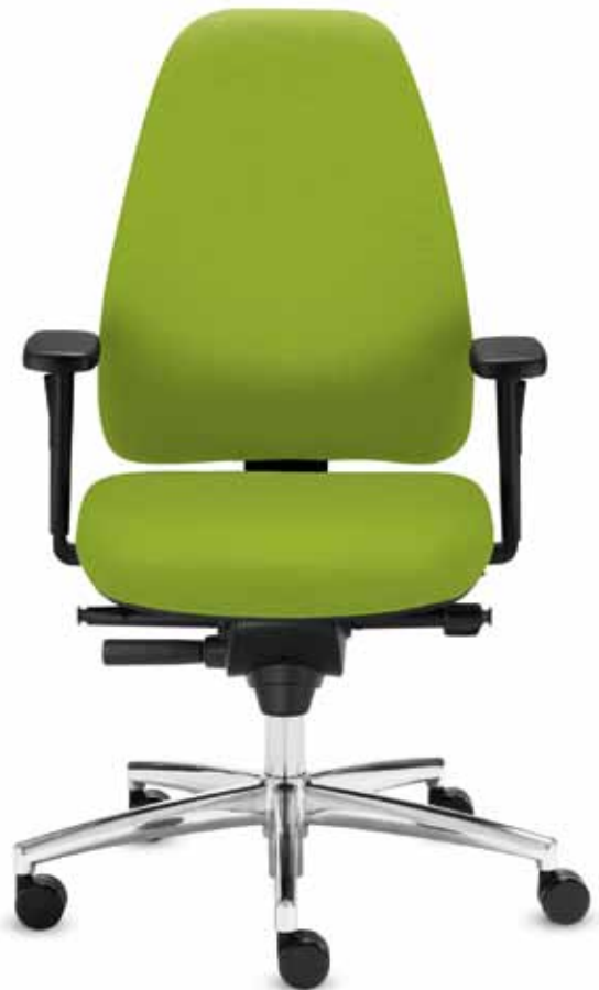
BS+ FO 93195 + Armlehnen/Armrests 155

Swivel chair with especially flexible, medium-high plastic backrest (52 cm) for maximum comfort when sitting . Daumatic-Balance® mechanism automatically adapts to the user's body weight, engageable automatic seat tilt.