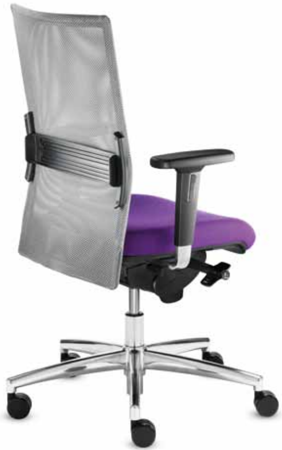
BS+ SM 96725 + Armlehnen/Armrests 172

Swivel chair with medium-high mesh backrest (50 cm) and changeable seat upholstery. The multi-functional armrests with soft PU armrests are height-adjustable (10 cm), width-adjustable (2.5 cm on each side) without the use of tools, depth-adjustable (4 cm) and have a 30° swivel range on both sides.